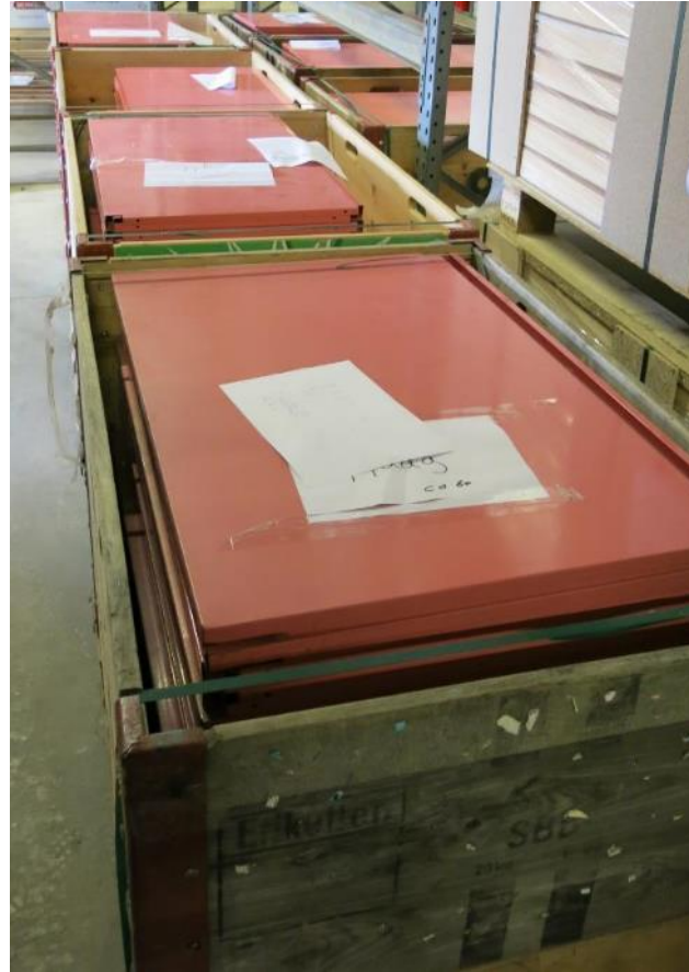
Anlieferung gebrauchter Fachböden unseres Kunden zur Neubeschichtung.