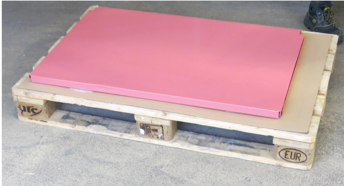
Die Artikel werden geprüft ...