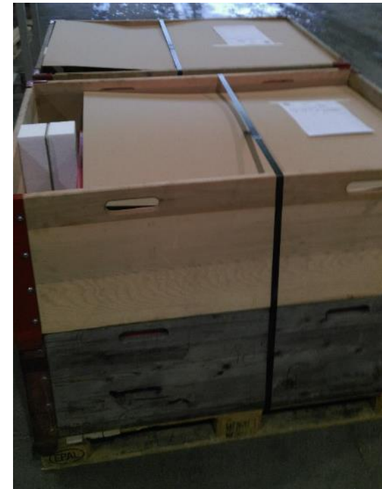
.. und stehen Ihnen wieder zur Verfügung.